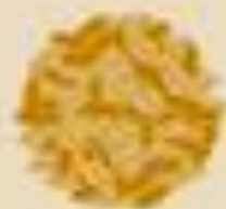
Зерна пшеницы, ячменя