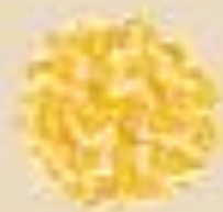
Подсушенные крошки белого хлеба