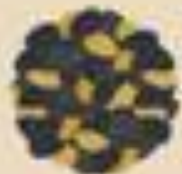
Несоленые семечки (тыквы, подсолнуха и др.)